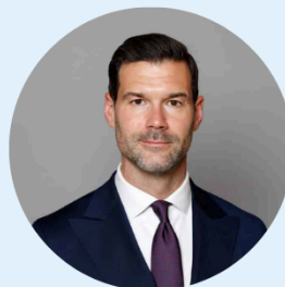
Johan Forsell Förbundsordförande Migrationsminister

Välkommen till årsmöte med våra sex moderatföreningar i krets tre. Den 19 februari klockan 18:00 inleder vi med att lyssna till vår årsmötestalare, Stockholm stads förbundsordförande och Sveriges migrationsminister, Johan Forsell. Sedan klockan 19:00 startar föreningens årsmöte.