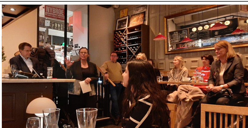
Från medlemsmötet med dåvarande migrationsminister Maria Malmer Stenergard på Nybroe Smörrebröd 22 januari 2024.

Styrelsen har under verksamhetsåret haft 6 st protokollförda sammanträden (17/1, 13/2 konstituerande möte, 9/4, 4/9, 10/10 samt 20/11), samt ett arbetsmöte inför EU-kampanjen 16/5. Därtill har styrelsen organiserat årsmötet 13/2.